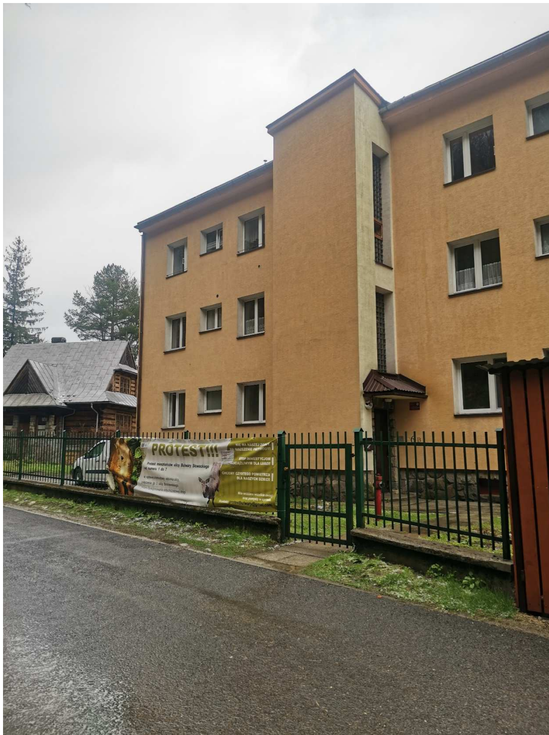
Fot. nr 1 Widok elewacji północno – wschodniej – wejście główne