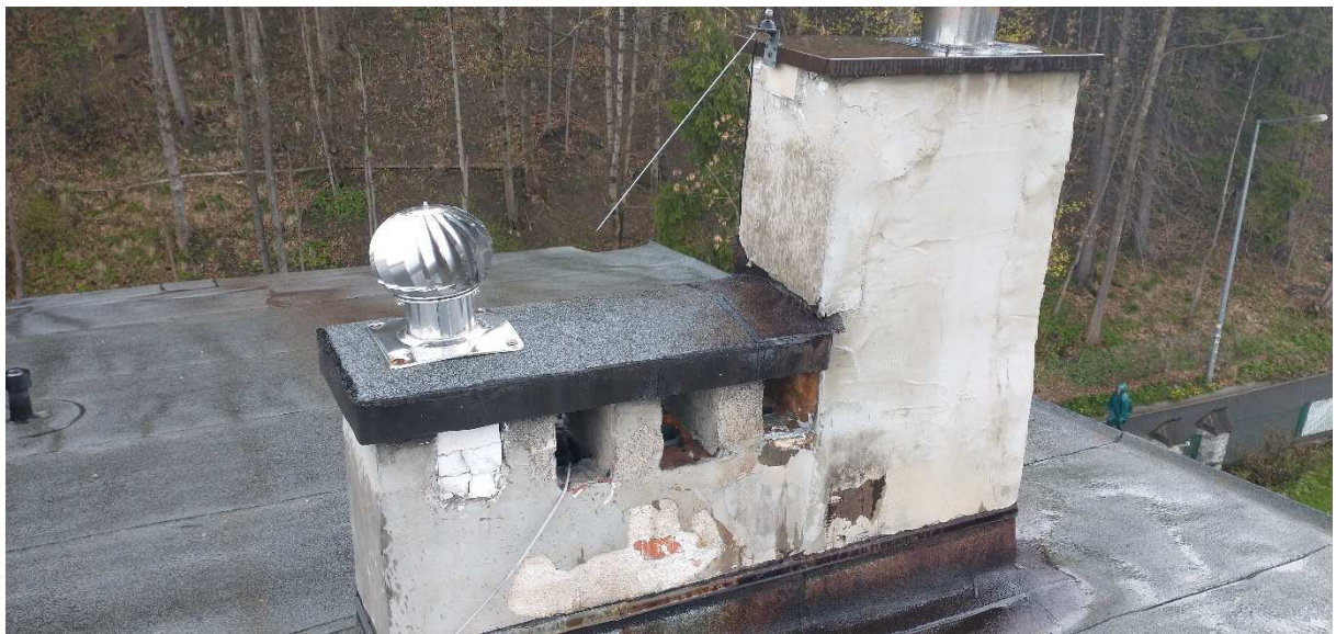
Fot. nr 9 Komin nr 8