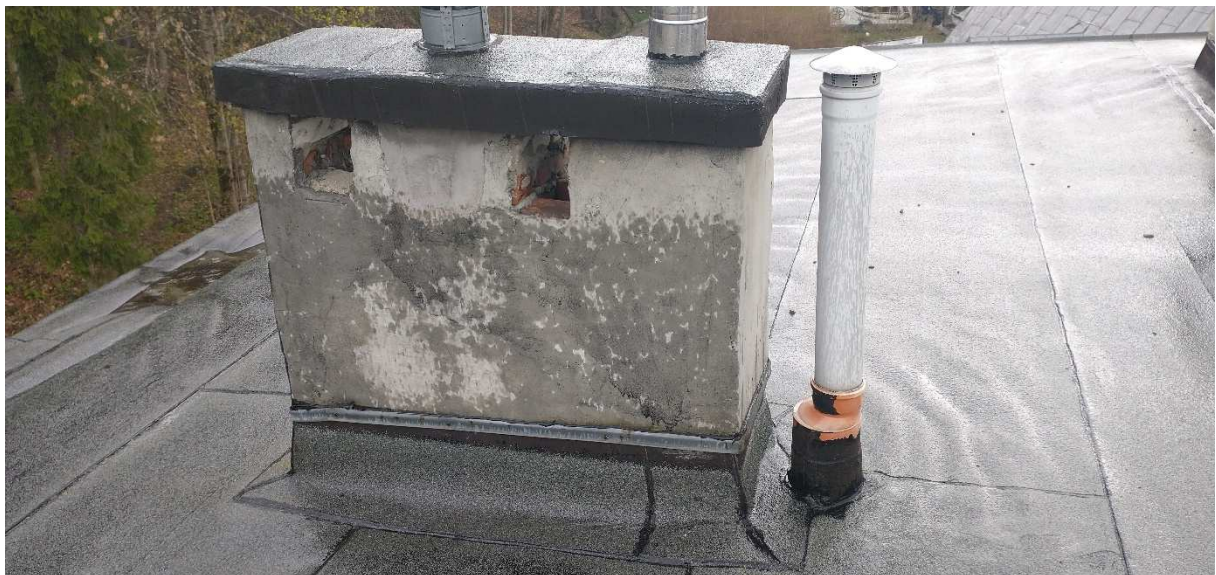
Fot. nr 5 Komin nr 4