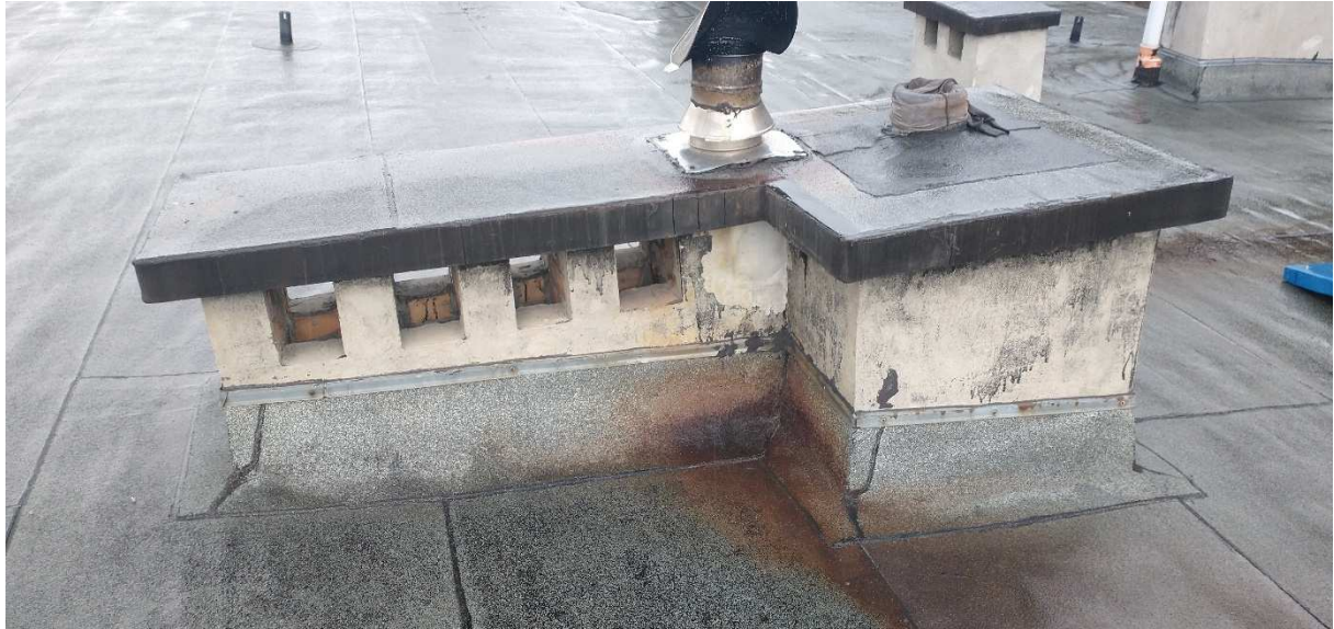
Fot. nr 10 Komin nr 9