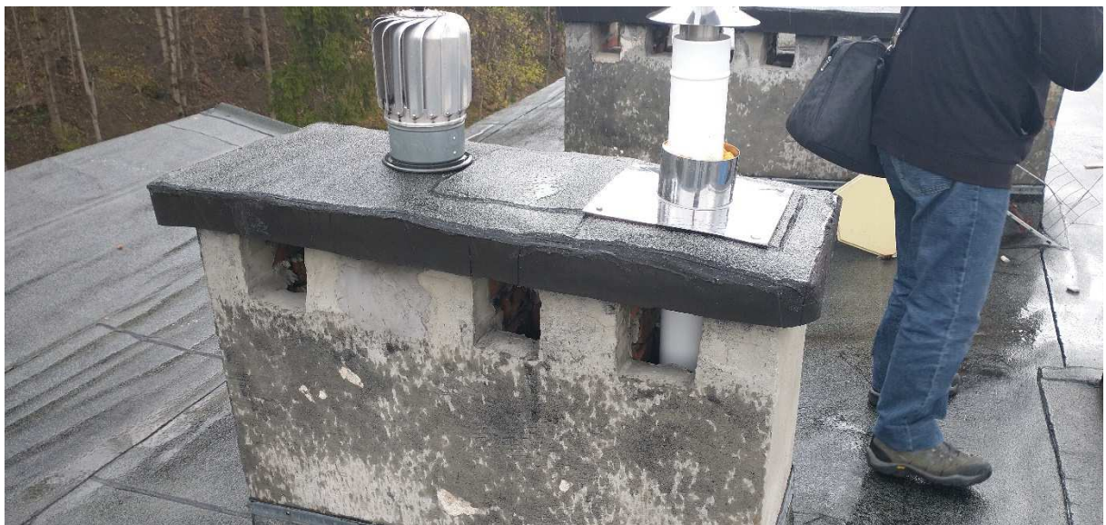
Fot. nr 3 Komin nr 2