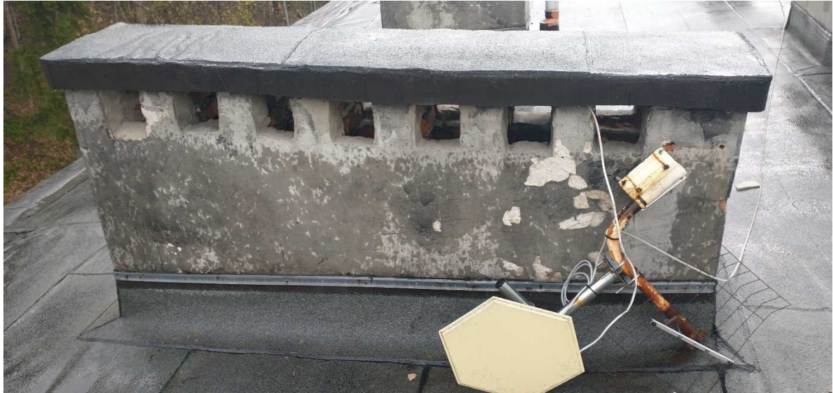
Fot. nr 4 Komin nr 3