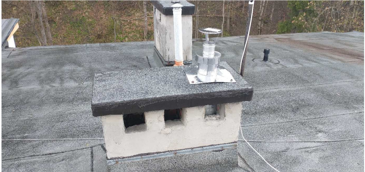
Fot. nr 8 Komin nr 7