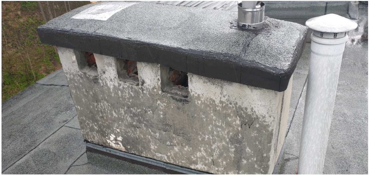
Fot. nr 2 Komin nr 1