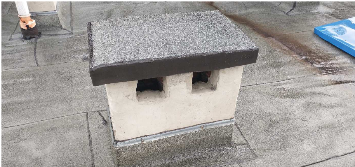
Fot. nr 7 Komin nr 6