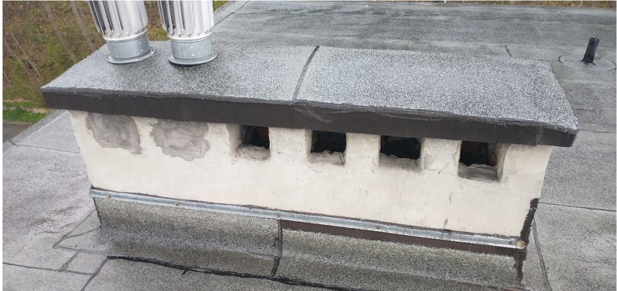
Fot. nr 6 Komin nr 5