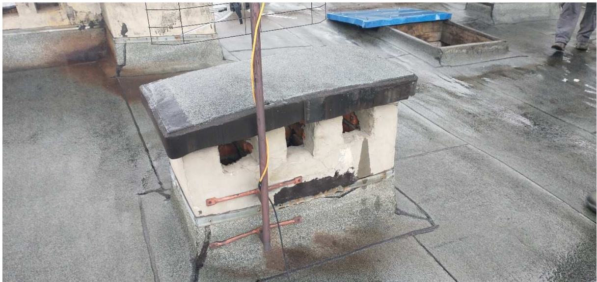
Fot. nr 11 Komin nr 10